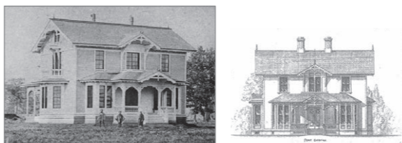
明治6年に完成した札幌の開拓使本庁分局庁舎。明治2年刊行のパターンブック『National Architect』の掲載図面(右図)をもとにデザインされた。

から世界の共通スタイルである椅子座へ移行させたいと考えました。幼少期に厳しくつけられて正座を課せられた彼は、訪米で椅子座に出会い、気苦労なく暮らせる自由さに惹かれ、アメリカ式住宅に理想形を見出したのです。