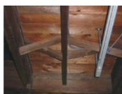
バルーン・フレーム構造による旧札幌農学校農園穀物庫(明治10年)。板状断面材が配され、垂木つなぎでつながれた小屋組(左)や2階床の振れ止め(上)が特徴。