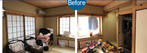
以前、夫妻のお母様が使っていた8畳の和室。