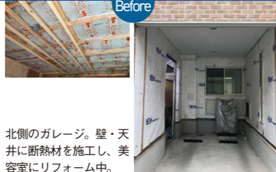
北側のガレージ。壁・天井に断熱材を施工し、美容室にリフォーム中。