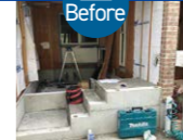
ガレージの入り口を後ろに半間下げて美容室へのアプローチ階段とした。