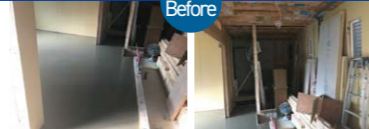
親世帯の水廻り・和室をカフェの厨房・客席へとリフォーム中。ベタ基礎スラブ天を床にした。