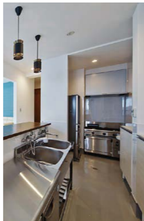
業務用設備機器が設置された厨房。床は客席よりさらに20cm低くなっている。配管スペースは厨房のカウンター下に配置されている。