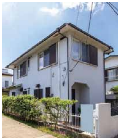
屋根と外壁の再塗装が行われた外観。

階段脇にある納戸内にシューズクロークが新設され、廊下にはコートや小物類を収納するクロークが設けられた。外出の際に便利だけでなく、玄関まわりを常にすっきりと保つことができる。