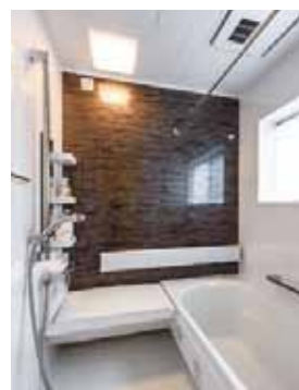
拡張された共用のバスルーム。バリアフリーに配慮され、手すりやベンチ、浴室換気乾燥暖房機がついている。